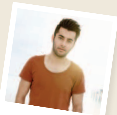
Hjelp til selvhjelp